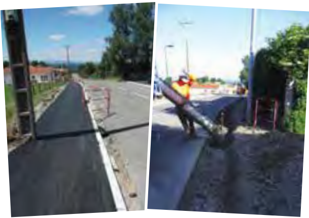
Chaque année la municipalité programme d'importantes réfections de réseau routier communal. Les interventions ont eu lieu route du Sarret, sur les trottoirs des Grangers et au cimetière.