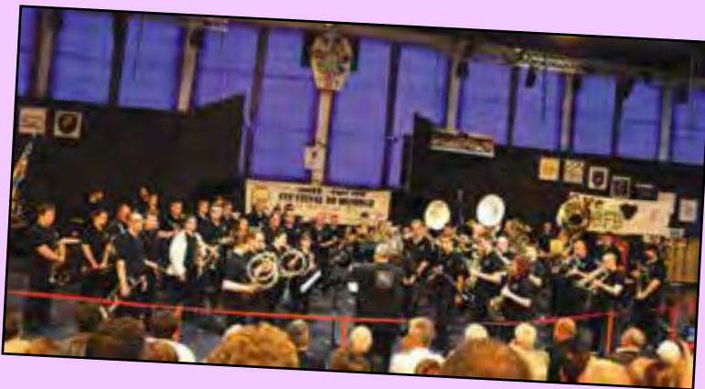
Passion BF Bourgogne, concourant en division G.P.N., conserve son titre de Champion de France.