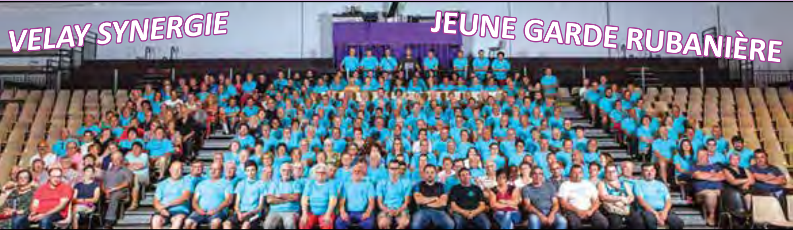
Près de 400 bénévoles pour accueillir les musiciens de 22 sociétés participant aux concours

Du 2 au 4 Juin - Grands Prix Nationaux (G.P.N.) de Musique F.S.C.F.