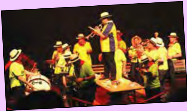
Un peu de banda pour l'ambiance...