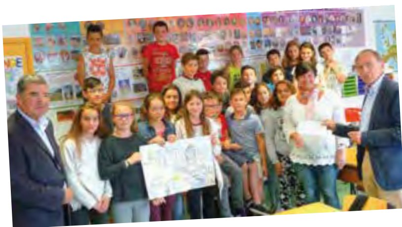
Remise du 1er prix départemental du patrimoine au CM2