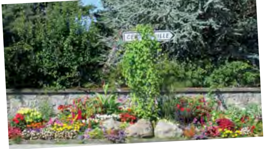
L'entretien tient une place prépondérante dans les plannings des agents des services techniques : tonte, élagage, fauchage des accotements, nettoyage des grilles et des déversoirs d'orage sans oublier l'ensemble des travaux dans les bâtiments communaux