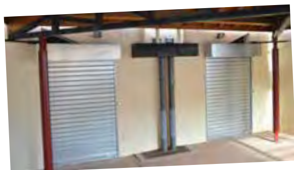
Deux rideaux métalliques ont été installés à l'entrée du restaurant solaire