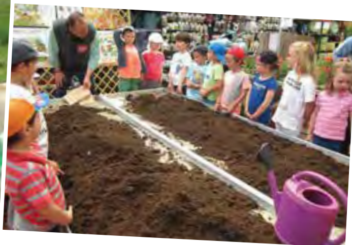
Sortie scolaire des Maternelles : découverte d'une bergerie et d'une jardinerie