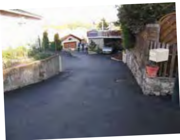
Au village de Jurine, au-delà de la réfection de la voirie, ce sont l'ensemble des réseaux aériens très envahissants qui ont été enfouis. En outre, la canalisation d'eau potable a été remplacée par le Syndicat des Eaux de la Semène.