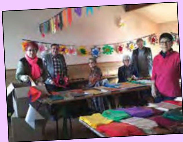
Des kilomètres de guirlandes et des milliers de fleurs pour la décoration des communes de Saint Just Malmont, Dunières et Saint Romain Lachalm.