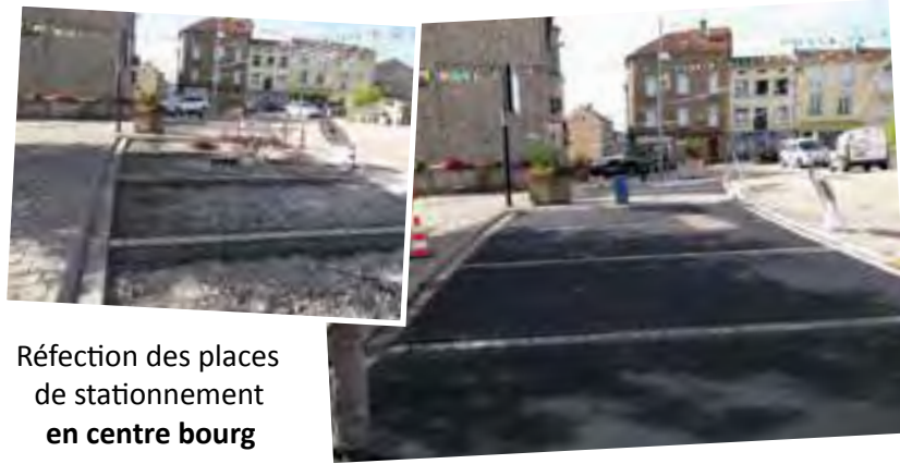
Réfection des places de stationnement en centre bourg