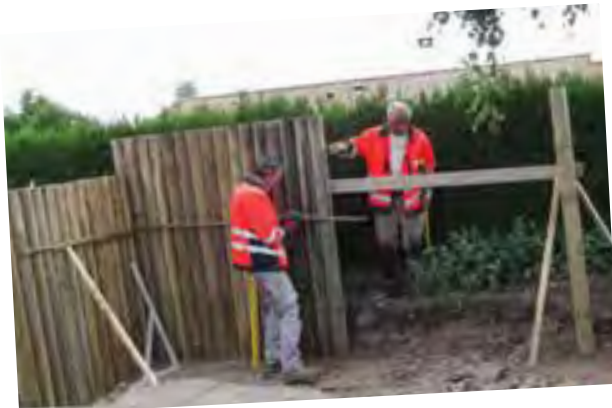
4 points de collecte équipés de bacs ordures ménagères et de bacs de tri (jaune) au Sarret