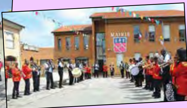
Le samedi matin, la place de la mairie était très animée avec les Cors des Alpes de Brignais, les Hibiscus d'Or et Marie Stella de Guadeloupe.