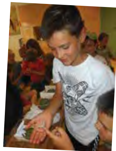
La sériculture n'a plus de secrets pour les élèves de cycle 3

Notre projet lecture nous a fait partager de nombreuses aventures !