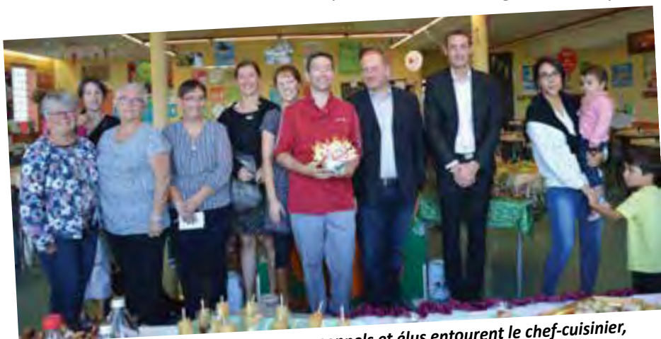
Enfants, parents, enseignants, personnels et élus entourent le chef-cuisinier, en présence de M. Carraud, responsable d'exploitation Elior

Le contrat avec la Société Elior prendra fin le 31 août 2018. Un appel d'offres aura lieu en début d'année pour une nouvelle consultation visant à confier à un prestataire l'approvisionnement en produits et denrées alimentaires, la confection et la fourniture de repas sous mode de service à table sur le site pour le restaurant scolaire municipal, et conditionnés pour le portage sur les sites annexes de la crèche et la cantine de Malmont.