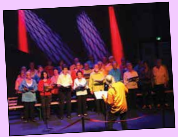
Deux chorales et une école de musique...