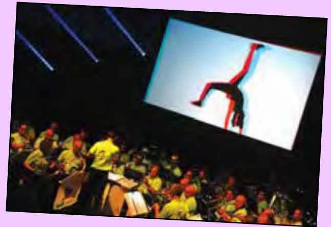
Des images et des ombres en relief...