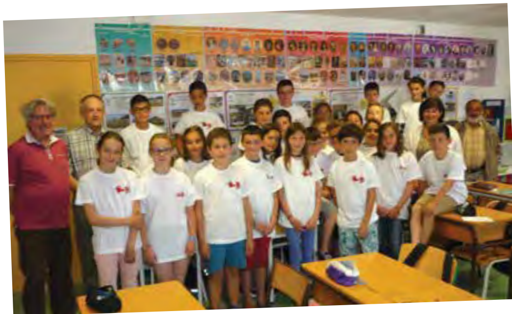
Classe de CM1-CM2 de l'école Don Dosco