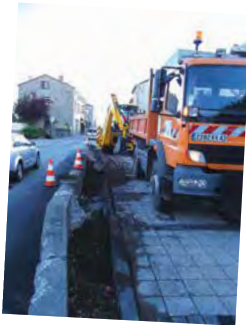
La démolition des piles en briques aux abords de l'ADMR, rue Nationale , laisse place à plus de visibilité et a permis d'élargir chaussée et aire de stationnement