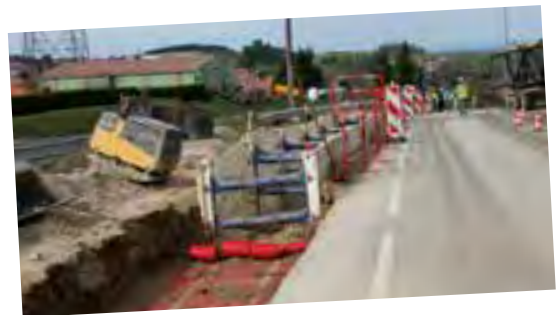
Les travaux de construction de la ligne très haute tension entrent dans leur phase terminale puisque la nouvelle ligne est pratiquement achevée. Sur notre commune il ne "reste" plus qu'à faire disparaître les pylônes de l'ancienne ligne, débarrassant ainsi la zone urbanisée du surplomb de cette ligne.