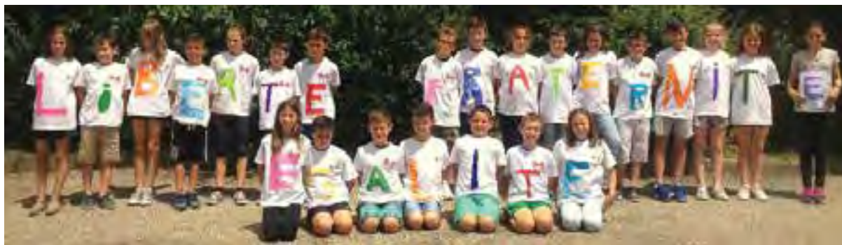
Lectures, apprentissages au fil des mois et spectacle de fin d'année autour de thèmes qui nous sont chers !