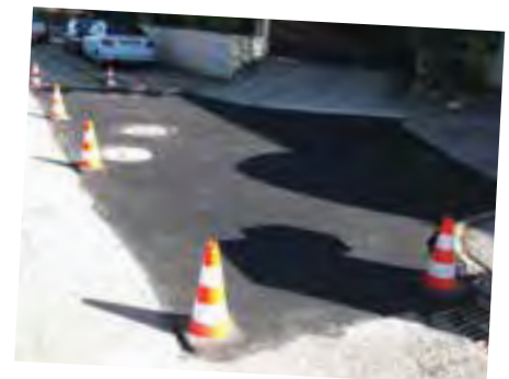
Reprise de voiries communales aux abords des entrées d'habitations au Sarret, à Malmont et rue de Riopaille