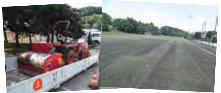
Une fois par an, il est nécessaire de décompacter le terrain du foot synthétique, pour un plus grand confort de jeu mais également pour allonger la durée de vie de l'aire de jeux.