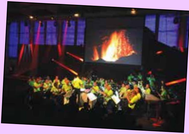
200 acteurs, 1800 spectateurs au spectacle en relief "Musique en 4 D" le vendredi et le samedi en soirée... le public était conquis...!!!