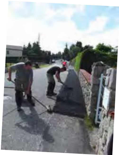
Stabilisation et finition des accotements Chemin de La Ratelière