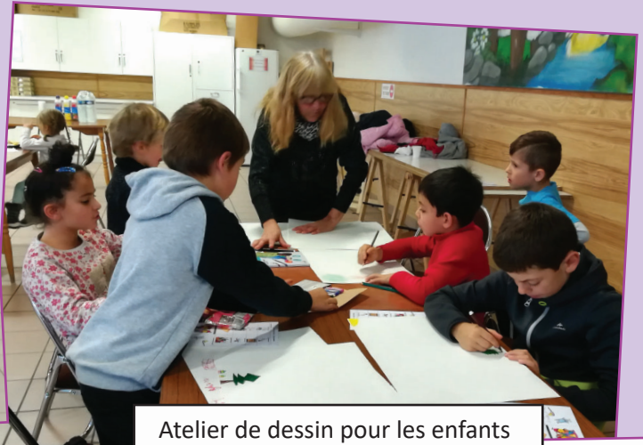
Atelier de dessin pour les enfants