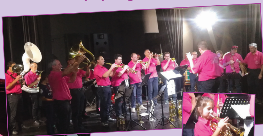
Batterie-fanfare de Lapte