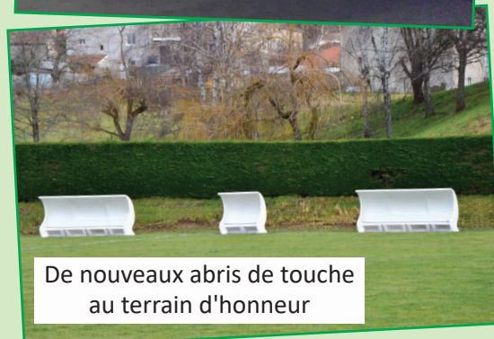
De nouveaux abris de touche au terrain d'honneur