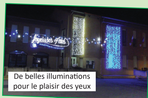
De belles illuminations pour le plaisir des yeux

Profitant de la douceur climatique, les agents techniques ont installé dernièrement des abris de touche sur le terrain d'honneur au complexe sportif afin de permettre à nos footballeurs de s'adonner à leur sport favori dans de bonnes conditions et d'être en conformité avec les instances footballistiques.