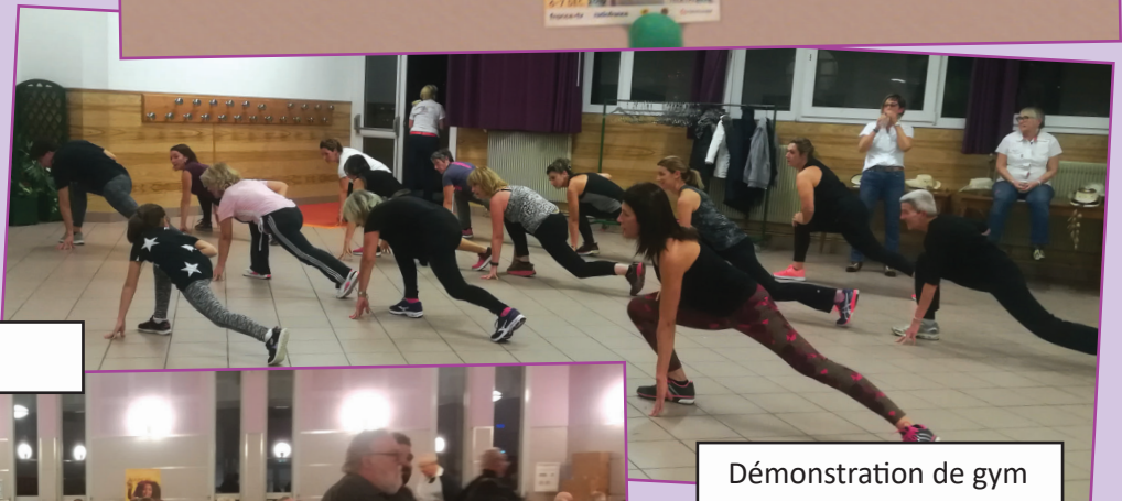
Démonstration de gym