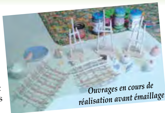
Ouvrages en cours de réalisation avant émaillage

Vous pouvez également consulter notre site internet http://famillesrurales-stjustmalmont.jimdo.com